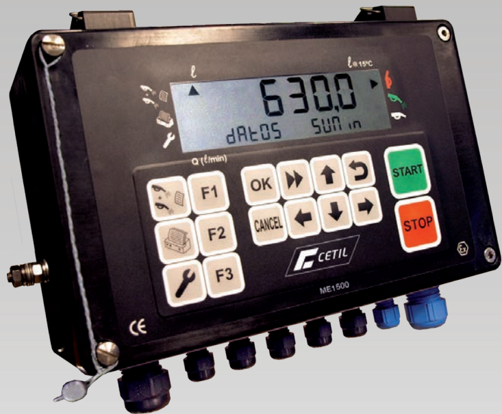
Calculador electrónico ME1500

Certificación MID y ATEX para zonas 1 y 2.