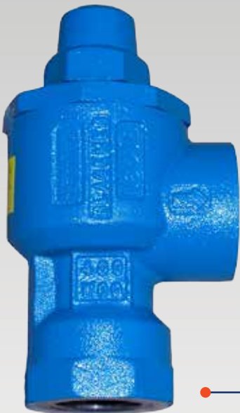
Válvula bypass BV0.75